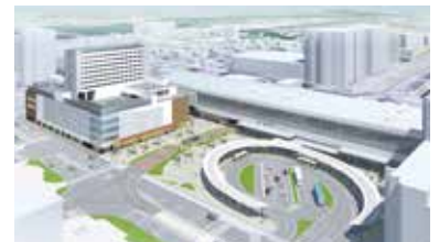
(富山駅南口広場イメージ図)