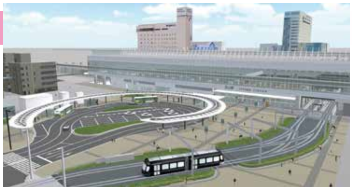
(富山駅北口広場イメージ図)

県都富山市の玄関口である富山駅周辺整備が進んでいます。今年は南北自由通路の仮設通路ができ、路面電車南北接続や周辺施設の整備も着々と進みます。来年3月に路面電車は南北接続されます。また、その後、北口広場や南口に新しい複合ビルが完成します。