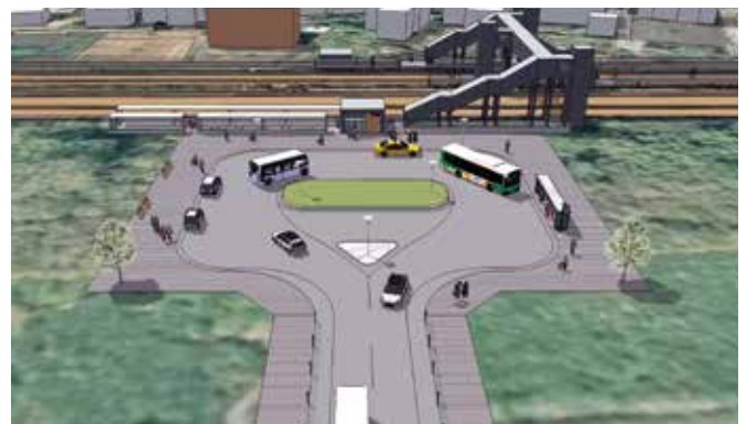
(新駅東口イメージ図)

富山駅～東富山駅間の新駅工事が始まります。アクセス道路や駅前広場などの新駅周辺整備については、県と富山市が連携して進めます。